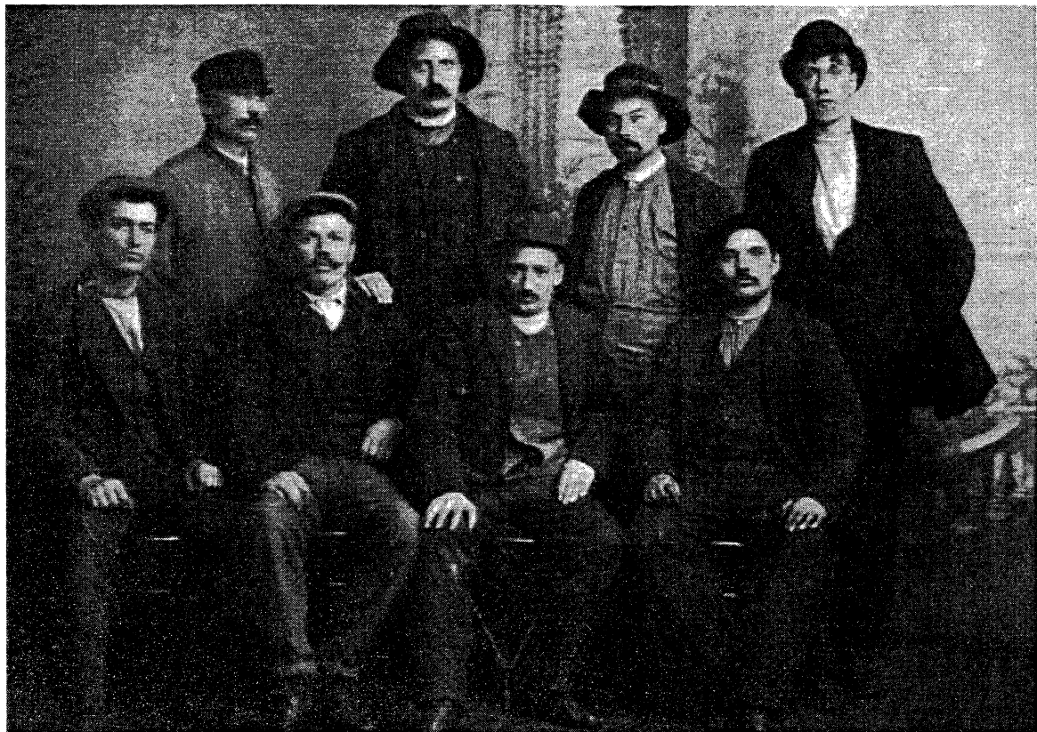
Gruppbild på 8 av 1912 års hemlöshetsundersökare.