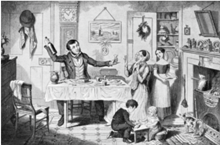
FLASKAN. FÖRSTA TAVLAN.

FLASKAN HUKKORNET FRÅN FÖRSTA KLÖNEN I DEN BATA HAVEN. HÄR SE HUR HUNTER TUGA OCH EN "STYRKUÄLLA."