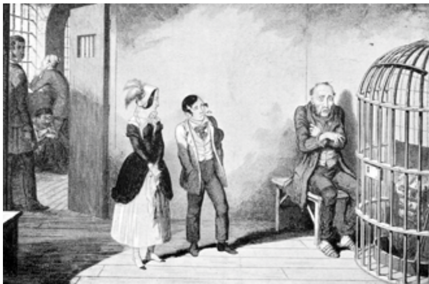
FLASKAN. ÅTTONDE TAVLAN.

"FLASKAN" HAR UTFÖRT SITT VÄRV: DEN HAR MÖRDAT MODERN OCH ETT BARN; DEN HAR GJORT SONEN TILL EN DAGDRIVARE, FADERN TILL ETT DÄRHUSEJOM, OCH LASTEN HAR TRYCKT SIN FRÅGEL I DOTTERNS ANSICHT.