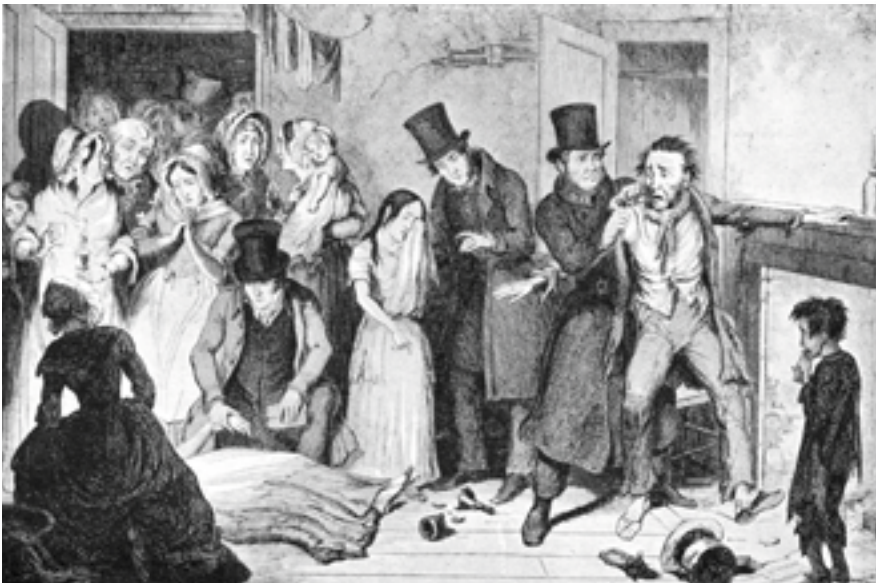
FLASKAN. SJUNDE TAVLAN.

FÖREKÄCKLIGA UPFTRÄDEN, SKRIK OCH SLAGMÅL ÄRO HELT NATURLIGA FÖLJDER AV DET FLITIGA BRUKET AV "FLASKAN"