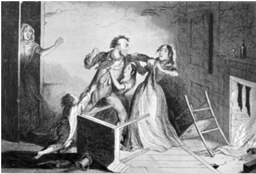
FLASKAN. SJÄTTE TAVLAN.

FÖREKÄCKLIGA UPFTRÄDEN, SKRIK OCH SLAGMÅL ÄRO HELT NATURLIGA FÖLJDER AV DET FLITIGA BRUKET AV "FLASKAN"